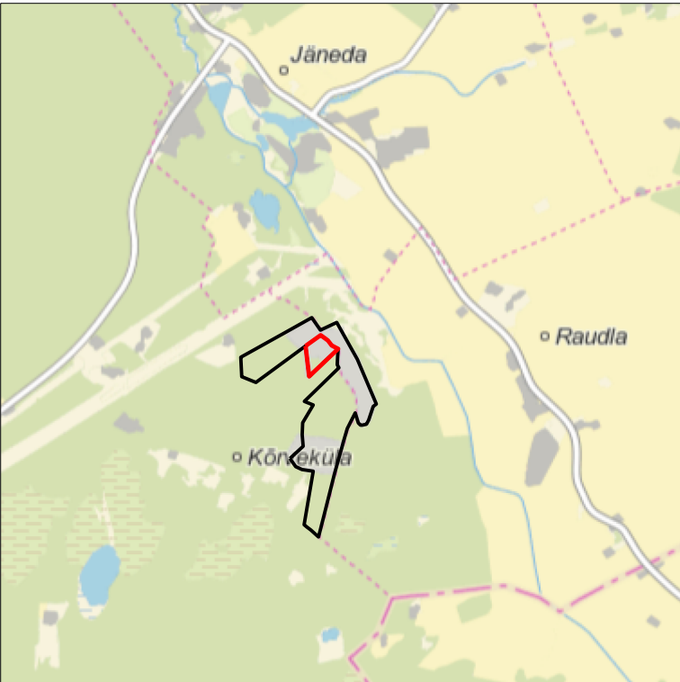
Kaardileht nr 6342 Aegviidu